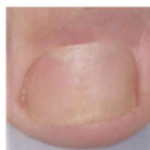
Μετά τη θεραπεία

Εάν δεν υπάρχουν σημεία βελτίωσης μετά από 3 μήνες θεραπείας, πρέπει να δείτε γιατρό.