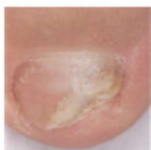
Πριν τη θεραπεία

Είναι σημαντικό να συνεχίσετε να χρησιμοποιείτε το βερνίκι νυχιών μέχρι να εξαφανιστεί η μόλυνση και να αναπτυχθεί ξανά ένα υγιές νύχι. Αυτό διαρκεί περίπου 6 μήνες για τα νύχια των χεριών και 9 έως 12 μήνες για τα νύχια των ποδιών. Θα δείτε ένα υγιές νύχι να μεγαλώνει καθώς το προσβεβλημένο νύχι απομακρύνεται μεγαλώνοντας.